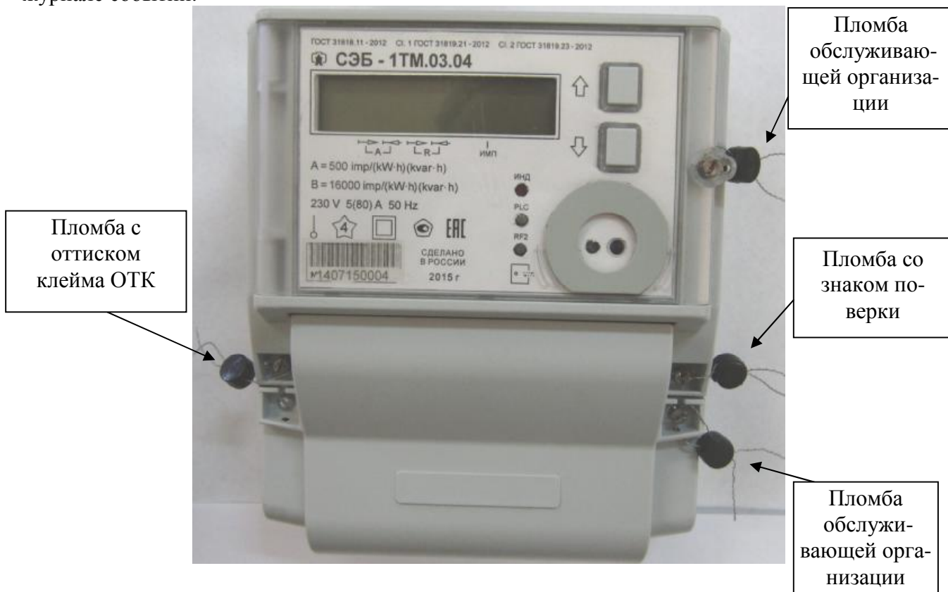
Рисунок 1 – Внешний вид счетчиков, предназначенных для установки внутри помещения, и схема пломбирования

В счетчиках установлен датчик магнитного поля, фиксирующий воздействие на счетчик магнитного поля повышенной индукции ( 2 \pm 0,7 ) мТл (напряженность (1600 \pm 600) А/м) и выше. Факт и время воздействия на счетчик повышенной магнитной индукции фиксируется в журнале событий.