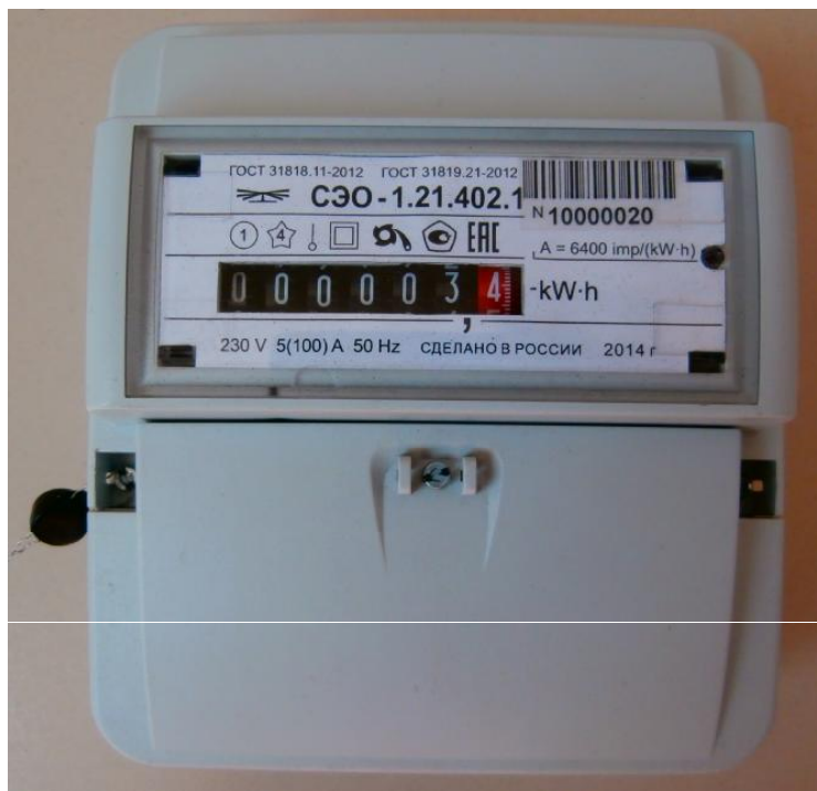
Рисунок 1 – Внешний вид счетчика с закрытой клеммной крышкой

Внешний вид счетчика СЭО-1.21 с закрытой клеммной крышкой приведён на рисунке 1.