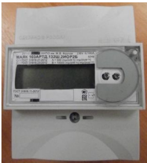
Рисунок 1 – Внешний вид счетчика с закрытой клеммной крышкой

Внешний вид счетчика МАЯК 103АРТД с закрытой клеммной крышкой приведён на рисунке 1.