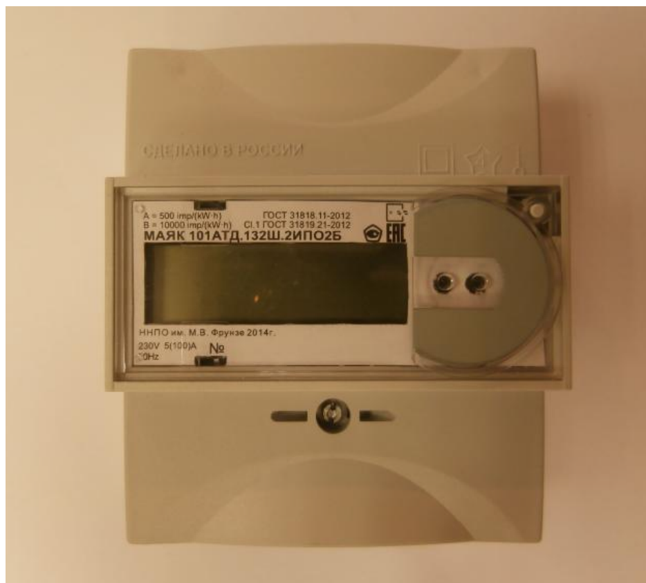
Рисунок 1 – Внешний вид счетчика с закрытой клеммной крышкой

Внешний вид счетчика МАЯК 101АТД с закрытой клеммной крышкой приведен на рисунке 1.