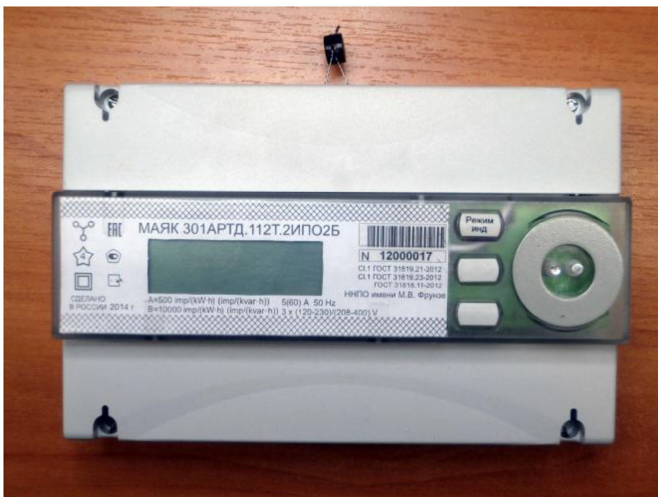
Рисунок 1 – Внешний вид счетчика с закрытыми крышками

Внешний вид счетчика МАЯК 301АРТД с закрытыми крышками приведен на рисунке 1.